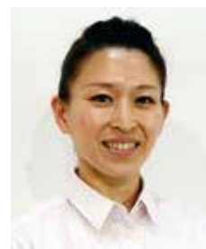
2017年12月12日の審査風景